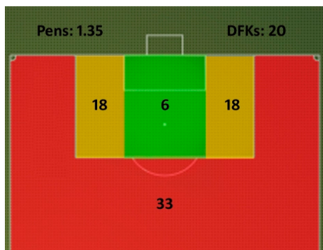
Figure 2: S.P.A.M.

La distanza dalla porta e l'angolo di tiro sono due fattori estremamente importanti quando si valuta la pericolosità di un'azione e se ne é accorto Paul Riley che ha condotto uno studio per valutare la reale pericolosità di un tiro in base alla posizione, lo Shot Position Average Model (S.P.A.M.). La figura 2 mostra quanti tiri sono mediamente necessari per segnare un gol in Premier League da una certa zona di campo.